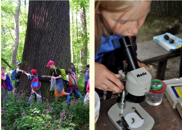
Natur kann sehr groß, aber auch sehr klein sein!

Nachhaltige Entwicklung ist heute das unerlässliche Leitbild, um ökologische Verträglichkeit, soziale Gerechtigkeit und wirtschaftliche Leistungsfähigkeit zu sichern. In diesem Kontext ist die Sensibilisierung besonders der nachwachsenden Generationen für die Belange des Umwelt- und Naturschutzes eine gesellschaftliche Aufgabe von besonderer Bedeutung.